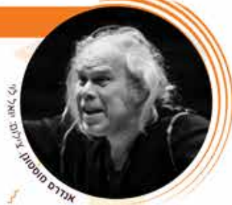
אנדרס מוסטון - גילום: אורן טל

יום ד' 19.2.2020 ב-20:30 במסגרת "מוסטון פסט" טאלין-ת"א